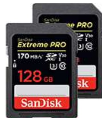
④ 메모리카드 128GB 2개