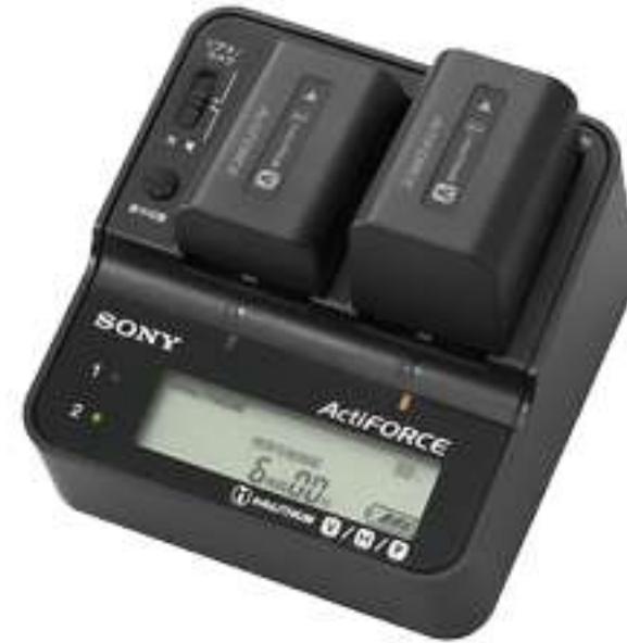
② 충전기 +배터리 2개