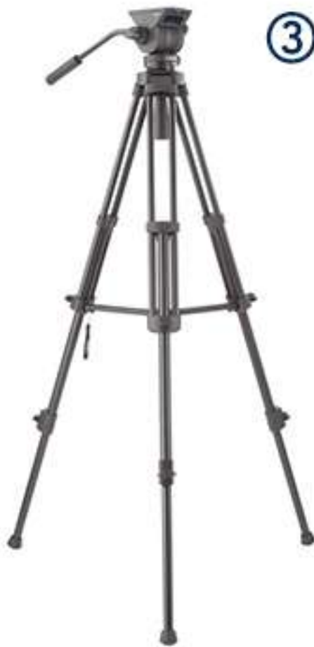
③ 리벡 삼각대