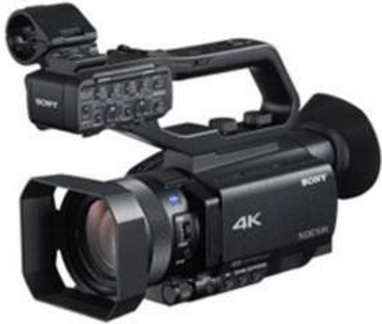
① PXW-Z90 카메라